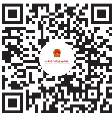
云南省人民政府公报小程序