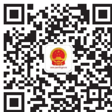
普洱市人民政府微信公众号